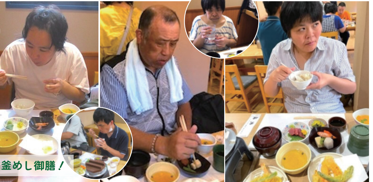
昼食はしらす釜めし御膳!