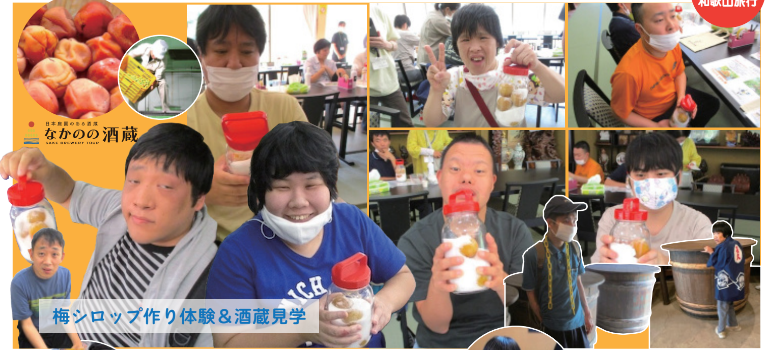
梅シロップ作り体験&酒蔵見学