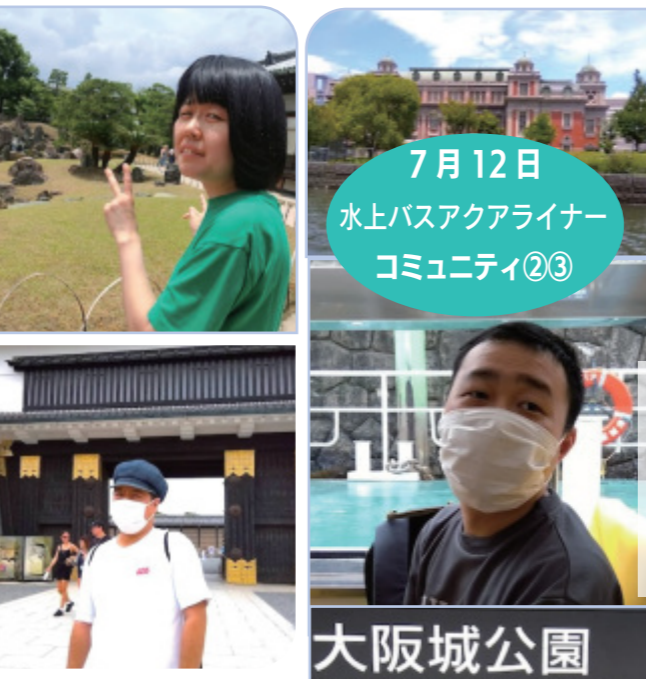
7月12日 水上バスアクアライナー コミュニティ②③

日差しも強くなりすっかり夏の1日。JR、地下鉄を乗り継いでのお出かけでした。世界遺産の御殿を見学し、美しく広〜いお庭を大汗かきながら散策しました。最後、休憩所でのデザートが最高に美味しかったことでしょう！