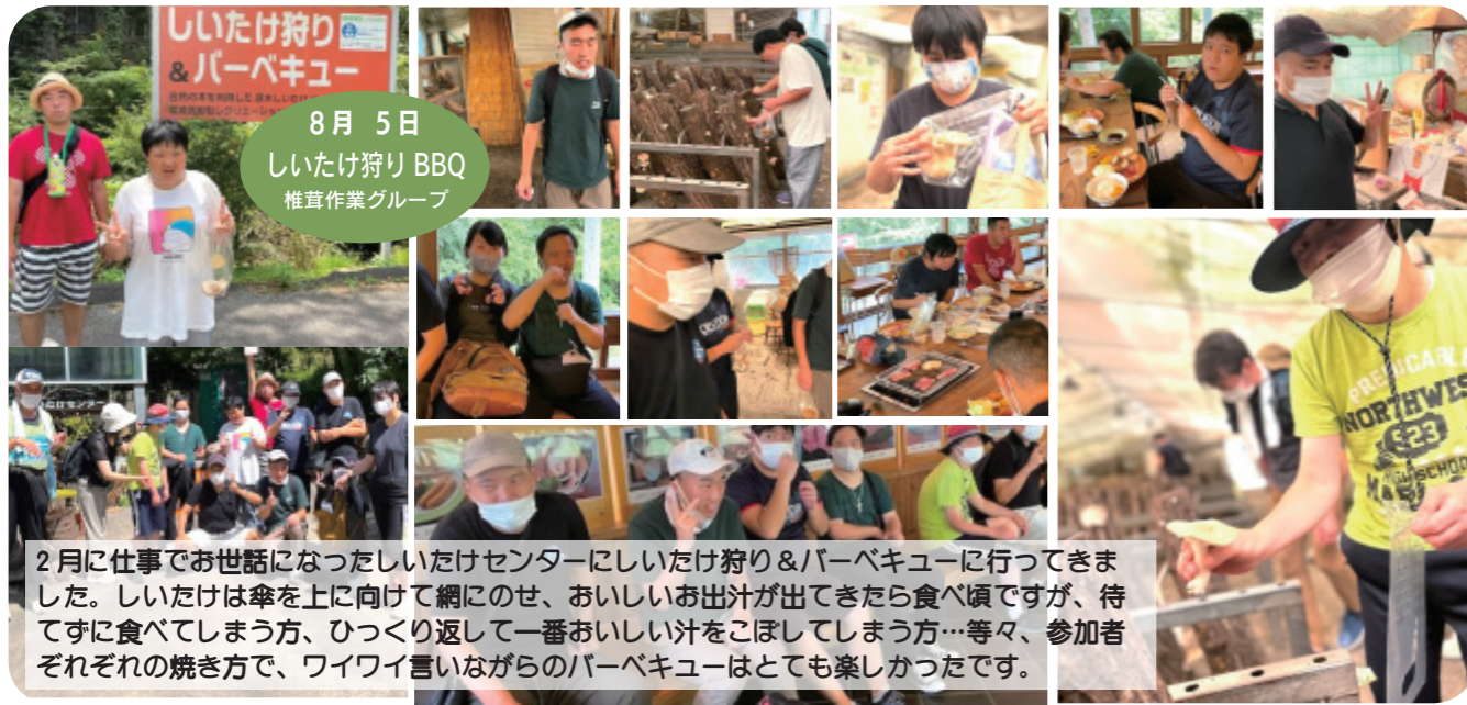
8月5日 しいたけ狩り BBQ 椎茸作業グループ

新しくオープンしてテレビで話題の門真アウトレットモールへ。ハンバーグ食べたい！お肉食べたい！ということで「石窯屋ハンバーグ」へ。目の前でソースをかけたぴはねを必死でガード。熱々をおいしく食べました。食後はウルトラマンの前でポーズ！屋上でデザート！漫画探し！思い思いの時間を楽しみました。