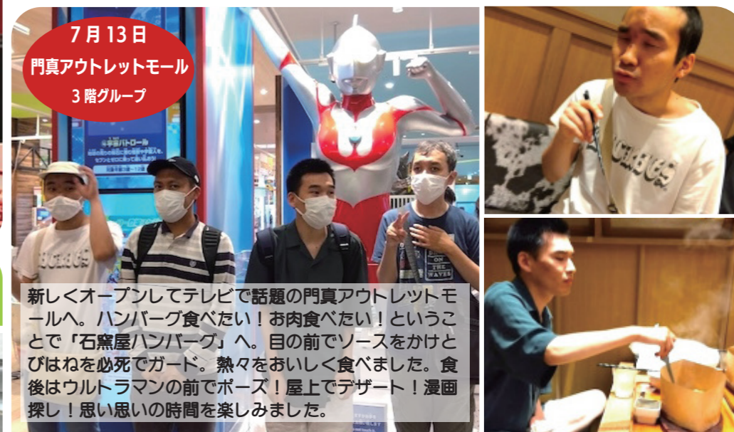
7月13日 門真アウトレットモール 3階グループ

新しくオープンしてテレビで話題の門真アウトレットモールへ。ハンバーグ食べたい！お肉食べたい！ということで「石窯屋ハンバーグ」へ。目の前でソースをかけたぴはねを必死でガード。熱々をおいしく食べました。食後はウルトラマンの前でポーズ！屋上でデザート！漫画探し！思い思いの時間を楽しみました。