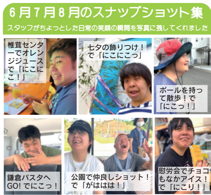
6月7月8月のスナップショット集 スタッフがちょっとした日常の笑顔の瞬間を写真に残してくれました

2月に仕事でお世話になったしいたけセンターにしいたけ狩り&バーベキューに行ってきました。しいたけは傘を上に向けて網にのせ、おいしいお出汁が出てきたら食べ頃ですが、待てずに食べてしまう方、ひっくり返して一番おいしい汁をこぼしてしまう方...等々、参加者それぞれの焼き方で、ワイワイ言いながらのバーベキューはとても楽しかったです。