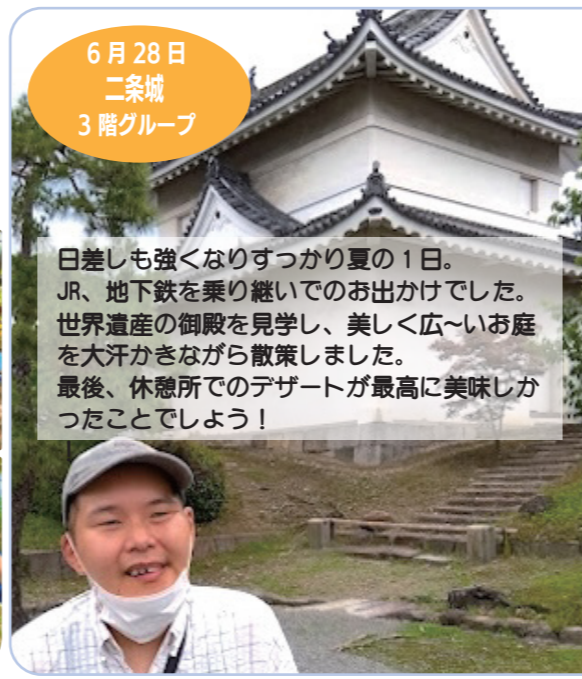
6月28日 二条城 3階グループ

当日はとても暑い1日で熱中症が心配な中ぶどうの木の下でお弁当を食べた後、食べたいぶどうの房を選んで収穫されてました。冷えたデラウエアではなかったのですが暑さを忘れるほどとても甘くて美味しく皆さん個性的な食べ方で夏の味覚を楽しんでおられました。