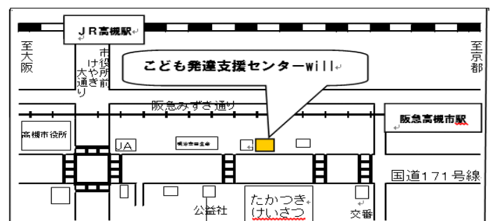
こども発達支援センターwill への交通アクセス