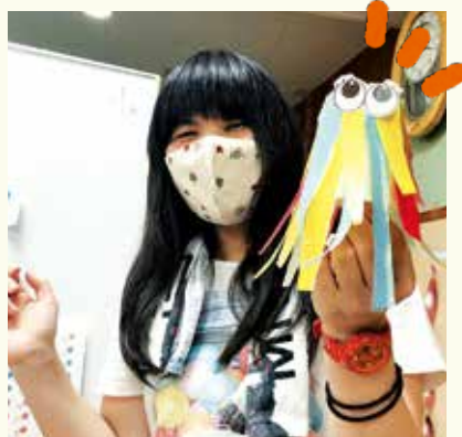
カラフルなみのむしができました