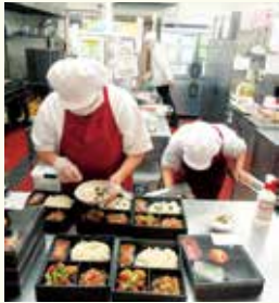
厨房の皆さん、ありがとうございます