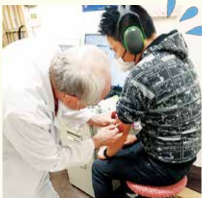
予防接種がんばりました