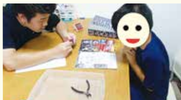
プラモデルの組み立て