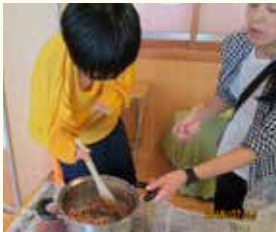
調理実習 (ハヤシライス)