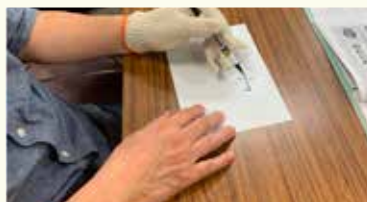
保護者研修「疑似体験」