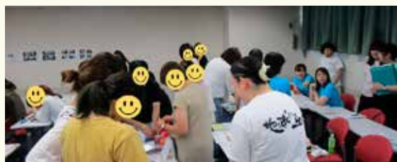
支援グッズ閲覧中