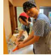
調理実習(カレーライス)