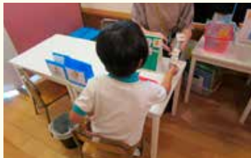
コミュニケーション