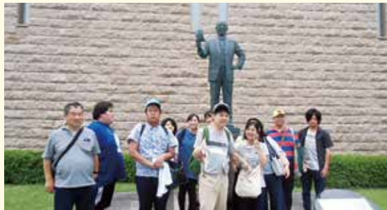
インスタントラーメン発明記念館