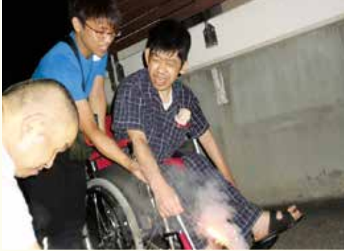
夏休みは“夏”を満喫しました♪ かき氷やスイカ割りも楽しみました!