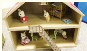
うまく並べることができました