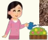
中庭でも野菜を栽培しています♪ 収穫が楽しみです!