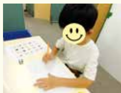
他者との気持ちの違いを知る