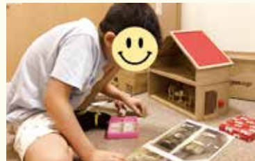
完成図を見てその通りに並べてみる