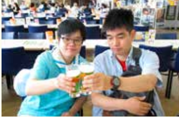
アサヒビール工場見学

今回も土曜日を中心に様々な余暇・外出プログラムを実施しましたのでご紹介させていただきます