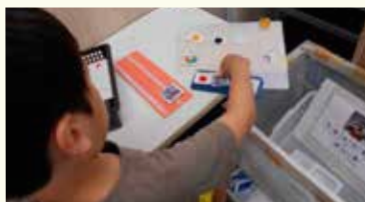
コミュニケーション練習文章を作って