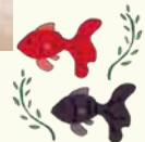
池にはメダカや金魚もいます♪