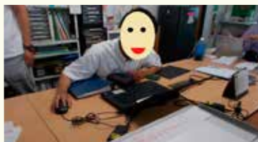
就労準備プログラム(企業実習)