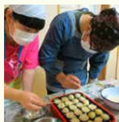
たこ焼きパーティー