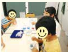
グループ活動「かき氷を作るう!」