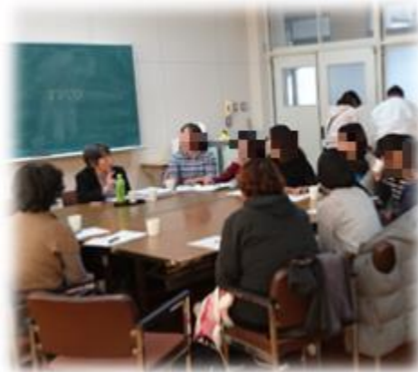
～小学校の保護者との交流会～