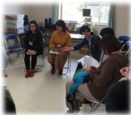
～少人数グループでの交流会～