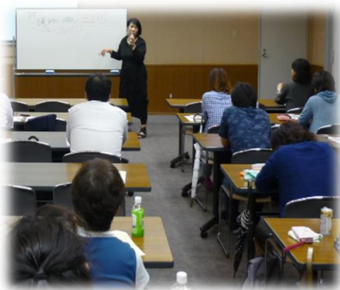
～啓発を目的とした講演会～

*ペアレント・メンターは専門家ではないため、発達障がいに関する講義などは実施できません。