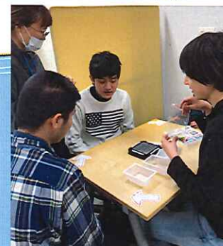
土曜開所日余暇活動 (グループでゲーム大会)