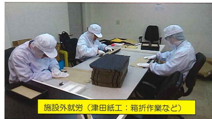
施設外就労 (津田紙工: 箱折作業など)