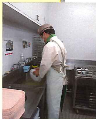
施設外就労 (POST かまどや洗い場)