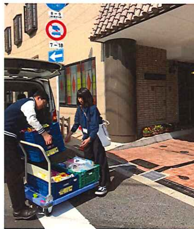
施設外就労 (病院への訪問販売)