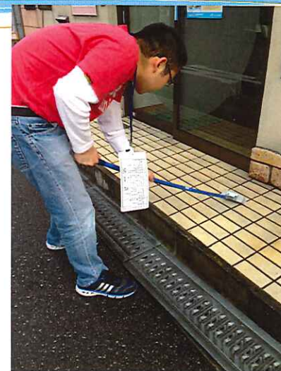
ビルメンテナンス (マンション清掃)