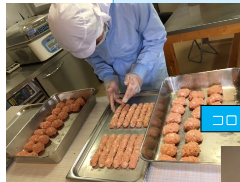
コロッケやつくね作り

施設内の厨房でコロッケを製造、施設から徒歩数分の店舗でコロッケを販売しています。利用者の特性や得意なことを活かしてコロッケの製造に携わって頂いています。