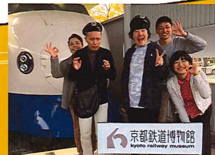
京都鉄道博物館 kyoto railway museum