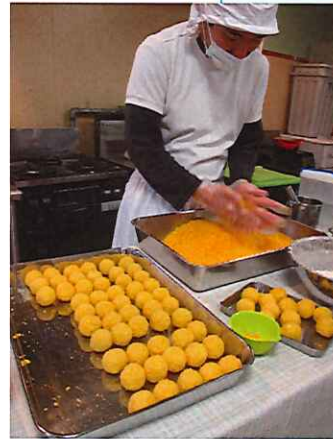
コロッケやつくね作り