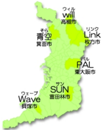
大阪府療育6センター (右図)