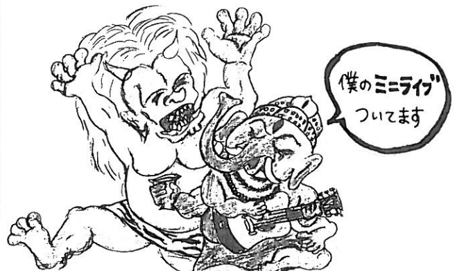
イラスト：上原大地さん

●お問合せ：福）北摂杉の子会 生活支援センターあんだんて 072-681-4755 担当 渡邊/内田